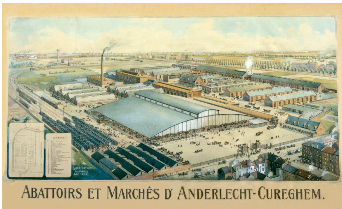
Fig. 2. Perspective, vers 1909, © Eckert & Pflug,

Son architecte Émile Tirou se serait inspiré, pour le marché aux bestiaux, des halles de la Villette et pour les échaudoirs de l'abattoir de Leipzig : « Il avait pensé qu'une partie de la halle ferait office de gare (a priori de marchandises) et les échaudoirs (lieu d'abattage) furent construits dans un style 'village' : ils se rangeaient dans deux rangées de bâtiments, de style néo-renaissance flamand. » (Vandemeulebroek, 1984 : 223) Les ateliers d'abattage se structuraient donc depuis un axe qui traverse la halle vers l'entrée principale encadrée par deux taureaux de bronze, un axe qui se dirigeait en ligne droite vers la rue Heyvaert et la zone urbaine.