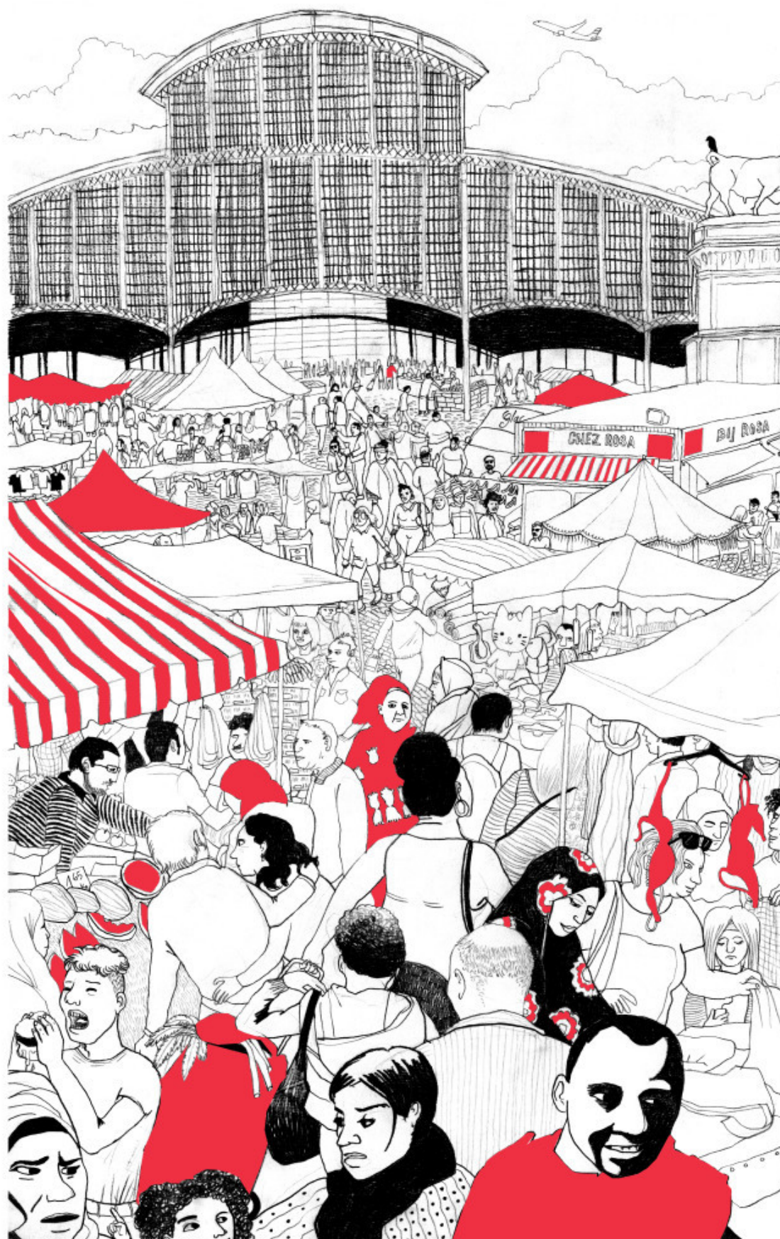
Fig. 1. Un marché, 2015 © Fabienne Loodts, pour l'Abattoir Illustré