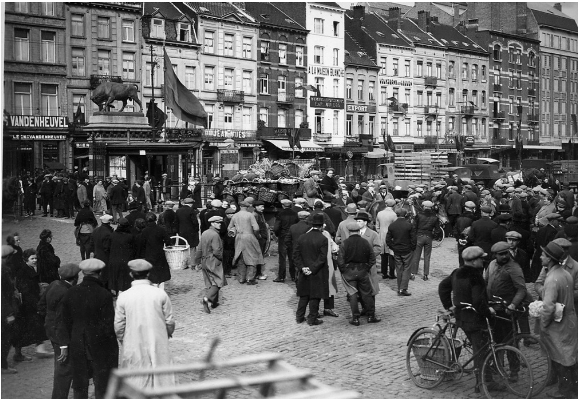
Fig. 3. Marché aux légumes et aux volailles vers 1925

Pendant soixante ans, la commune gèrera le site à travers la Régie de l'Abattoir et Marchés (RAM) dont les fonctionnaires assurent la direction, la logistique, l'entretien, le contrôle des taxes et la garantie sanitaire tandis que l'abattage, le nourrissage, l'achat et vente du bétail et de la viande est assurée par des exploitants titulaires d'une concession.